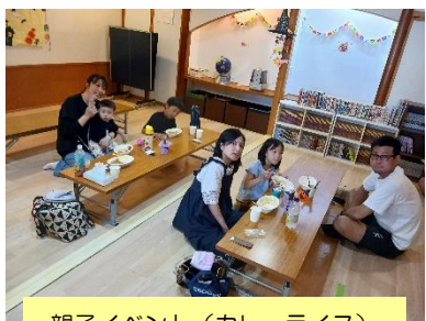
親子イベント（カレーライス）