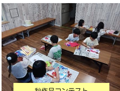
秋作品コンテスト