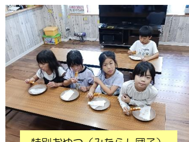
特別おやつ（みたらし団子）